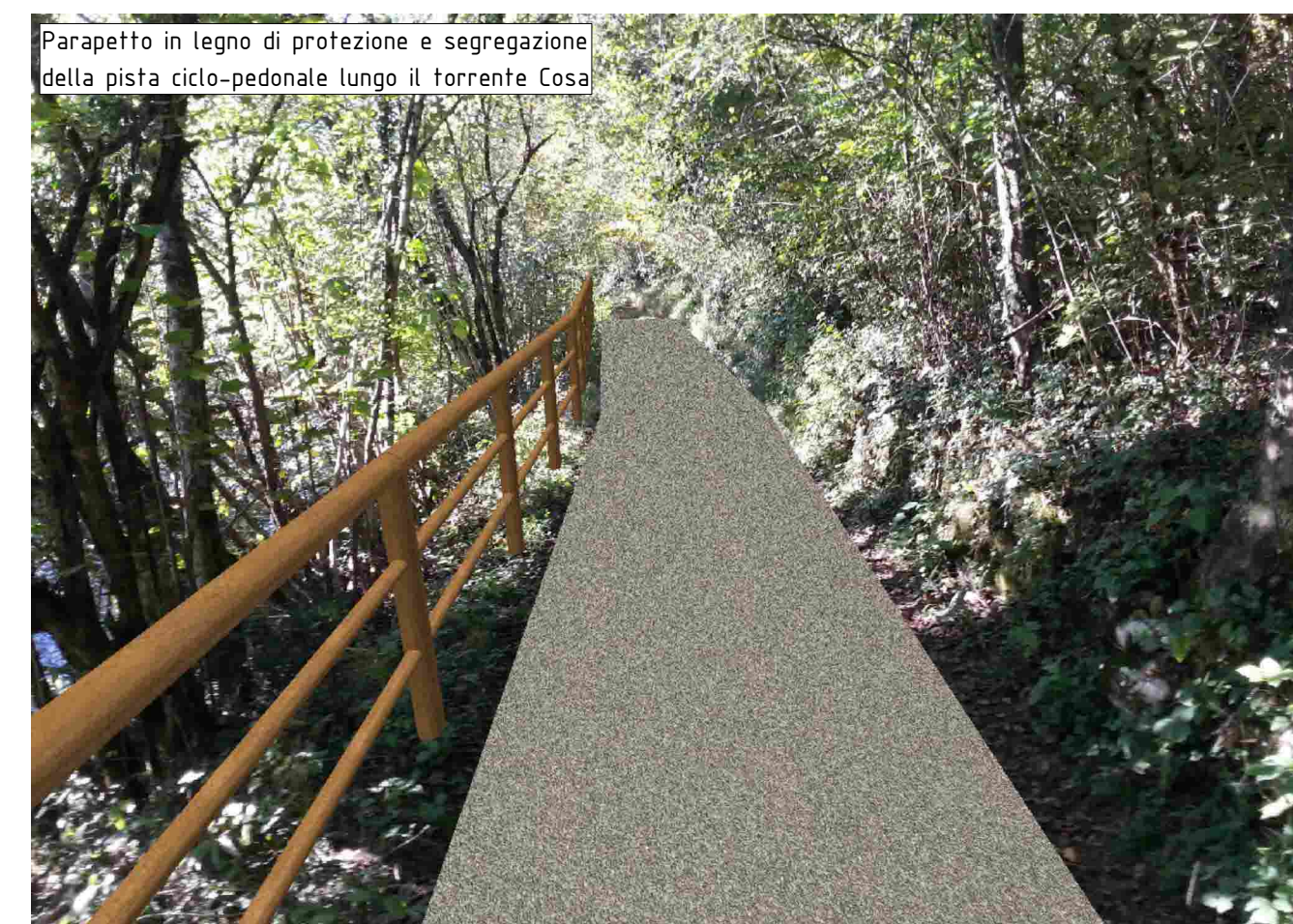
Parapetto in legno di protezione e segregazione della pista ciclo-pedonale lungo il torrente Cosa