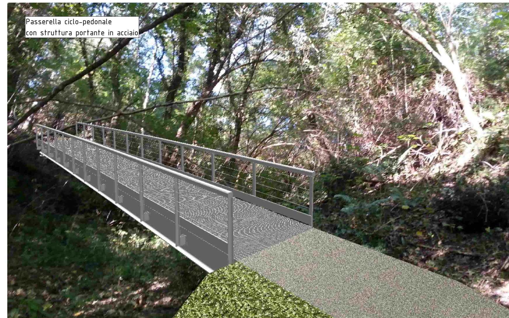
Passerella ciclo-pedonale con struttura portante in acciaio

Studio Tecnico ing. Roberto Egidi Progettazione - Direzione Lavori - Consulenza Sede: Via Colombera 1/b - 33080 Porcia (PN) tel +390434030157 fax 1782746280 e-mail info@robertoegidi.it pec roberto.egidi@ingpec.eu