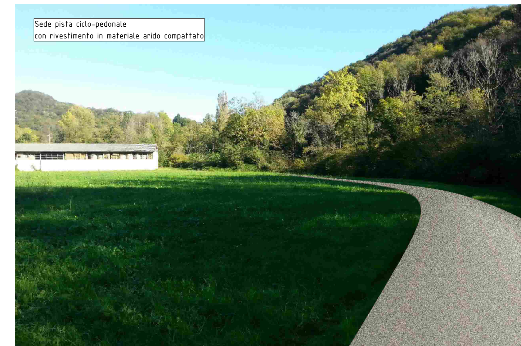
Sede pista ciclo-pedonale con rivestimento in materiale arido compattato