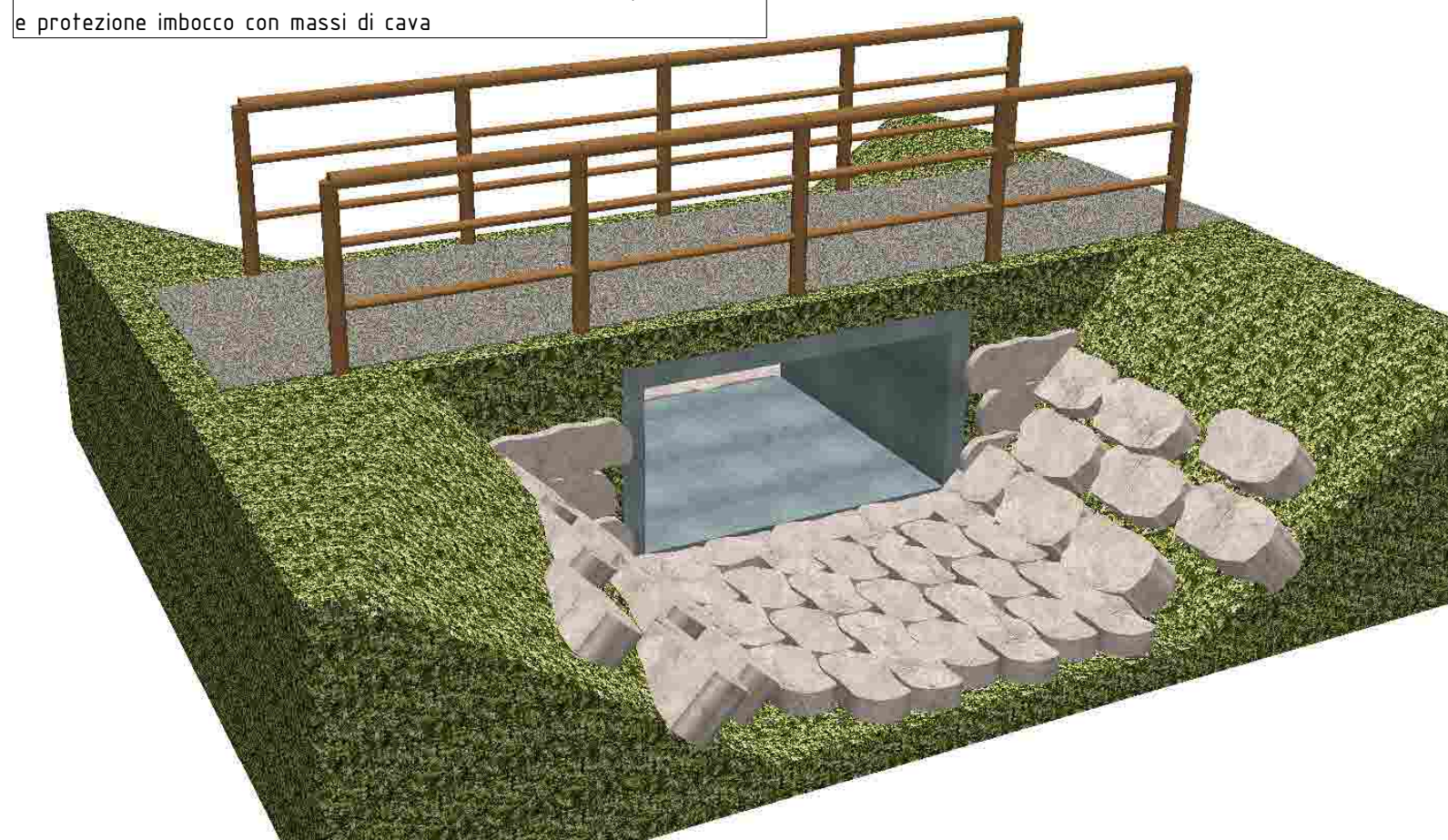
Attraversamento scolo secondario con elementi scatolari prefabbricati e protezione imbocco con massi di cava